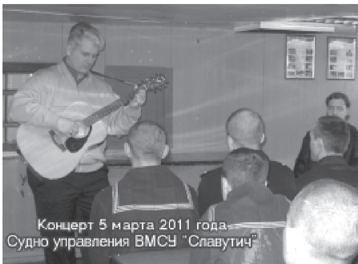
Концерт 5 марта 2011 года Судно управления ВМСУ "Славутич"