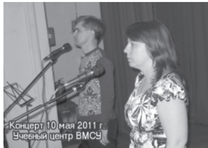
Концерт 10 мая 2011 г. Учебный центр ВМСУ