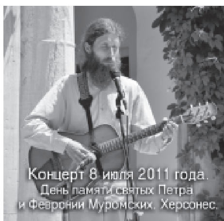
Концерт 8 июля 2011 года. День памяти святых Петра и Февронии Муромских, Херсонес.