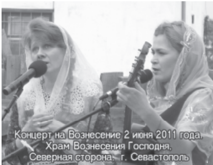
Концерт на Вознесение 2 июня 2011 года. Храм Вознесения Господня, Северная сторона, г. Севастополь