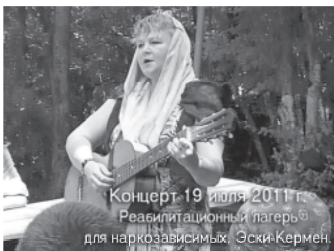
Концерт 19 июля 2011 г. Реабилитационный лагерь для наркозависимых, Эски-Кермен.