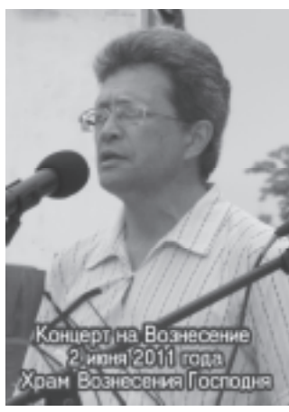
Концерт на Вознесение 2 июня 2011 года Храм Вознесения Господня