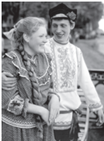
Жизнь ради другого человека — вот суть жертвенной любви.

Существует ли любовь, которая не проходит, не перестает, не умирает? Любовь, которая, как прочнейший состав, скрепляла бы семейные узы, делала их нерушимыми, неподвластными житейским бурям? Такая любовь существует и называется она ЖЕРТВЕННАЯ ЛЮБОВЬ. Это любовь, которая направлена не вовнутрь человека, для его личного и безраздельного пользования, а вовне — на партнера, жену или мужа.