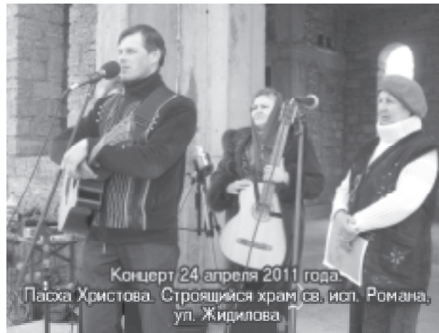
Концерт 24 апреля 2011 года. Пасха Христова. Строящийся храм св. исп. Романа, ул. Жидилова.