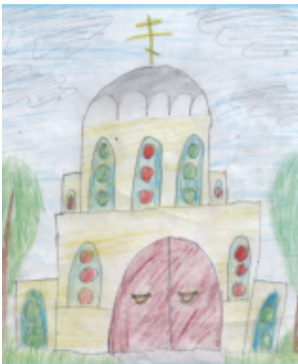
Гуникова Таисия, 10 лет