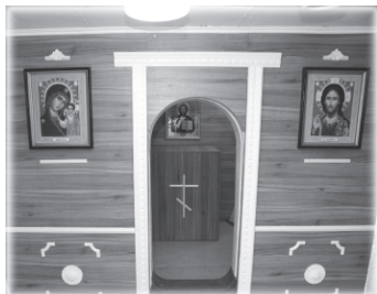
Корабельный храм святителя Николая

Катамаран-спасатель по праву называют судном-долгожителем, свидетелем нескольких эпох. Верой и правдой это судно служило флотам Императорской России, Советского Союза, а сегодня продолжает находиться в боевом строю Российского ВМФ. На счету «Коммуны» — более ста поднятых и отремонтированных кораблей и судов.