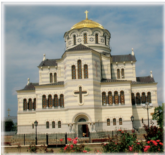
Общий вид верхнего храма, освященного во имя святого равноапостольного князя Владимира

Общий вид храма с западной стороны. Храм имеет вид креста, по архитектуре он так и называется — крестовокупольный. Большинство храмов на Руси — крестовокупольные. Такая планировка храмов пришла к нам из Византии. Главный вход в собор — справа. С левой стороны виден летний храм, в котором Патриарх Московский и Всея Руси Кирилл служил Божественную Литургию 2 августа 2009 года.