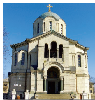
Свято-Владимирский собор — усыпальница адмиралов

В 1932 г. собор был закрыт. Во время войны 1941-1945 гг. здание собора было сильно повреждено. После реставрации в 1972 г., здание было передано Музею героической обороны и освобождения Севастополя. 19 сентября 1991 г. состоялось освящение собора. В нем хранятся редчайшие и знаменательные иконы Божией Матери: «Державная» и «Неупиваемая чаша».