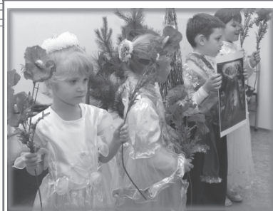
Ребята из ВШ «Покров» выступают перед больными севавтопольского хосписа

У нас, бывает, взрослые приходят в храм, следуя «по стопам» своих детей. Дети, бывает, начинают первыми исповедоваться, причащаться, поститься, а уж по их примеру — и родители.