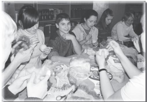
Учимся творить и мыслить

В этом году, 18 июля, «Севастопольские мамы» провели третий благотворительный аукцион «Волшебное сердце». На аукционе были