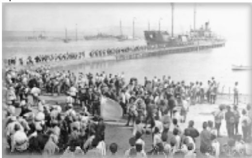
Посадка войск на корабли 14 ноября 1920 г.

По материалам: Православие.ру, пресс-служба УПЦ МП, пресс-службы Севастопольского благочиния