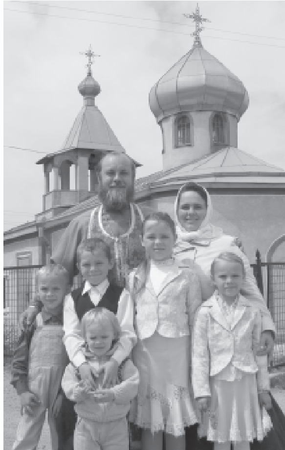
Моя семья — мое богатство! (храм Рождества Иоанна Крестителя)

Вот тогда уже не просто прошишь: «Господи, помоги», а кричишь: «Господи, проходи жизнь, проходи минуточка, я могу вечером лечь, а утром не встать. И рассвет наступит уже без меня. А мы-то остались в каких-то неприязненных отношениях».