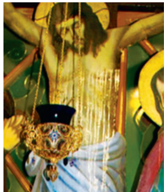
Мироточивое Распятие Господа Иисуса Христа

- С одной стороны, это последний призыв Господа к падшему человечеству, чтобы люди одумались, покаяться и пришли к Богу, а тем самым - к своему собственному спасению, - ответил нам священник. - Растление нравственное, разврат, насилие, убийства, наркотики, алкоголизм - человечество потеряло и совесть, и стыд. Когда-то мы спокойно ложились спать и не запирали в доме дверь. Сейчас все боятся друг друга. Родители - детей, дети - родителей. Люди стали зверями друг другу. И поэтому Господь призывает нас к покаянию. С другой стороны, Он хочет укрепить в нас веру.