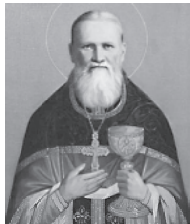
Св. прав. Иоанн Кронштадтский о Причастии

«Но вот спрошу я тебя, человек, чувствуешь ли ты духовную алчбу и жажду вкушать жизненный, сверхъестественный колос и зерно двурасленное, естественно-жизненное, - Плоть и Кровь Христа Жизнодавца, истинного небесного Хлеба, дающего жизнь миру? Если не чувствуешь этого спасительного глада, то значит ты духовно мертв. Человек начинающий выздоравливать, или здоровый, естественно чувствует голод и жажду. Сколько же этих мертвецов в России, в православной церкви, не чувствующих этой спасительной жажды? - Тьма-тьмущая! Множество бесчисленное интеллигентов совсем не бывают у причастия, множество люда бывает очень редко, многие только однажды в год причащаются. А Господь ежедневно взывает: примите, ядите ... пейте из нее все... (Мф. 26, 26-27) и нет ядущих и пиющих!»