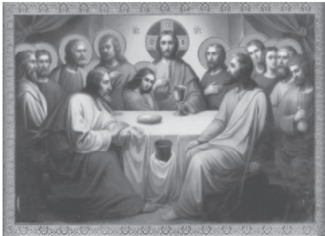
Икона «Тайная Вечеря»

Христианин готовит себя к Таинству Причастия постом, молитвой и исповедью. Отложив все земные заботы, сосредоточив ум и чувства на предстоящем Таин-