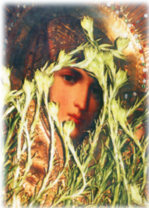
Икона Казанской Божией Матери

- Значит, это не человеческое произведение, а божеское, это доказательство того, что Господь еще не забыл Святую Русь, несмотря на все перипетии, которые были в нашей истории, это свидетельство того, что Он помнит о нас, охраняет и защищает, - говорит отец Павел.