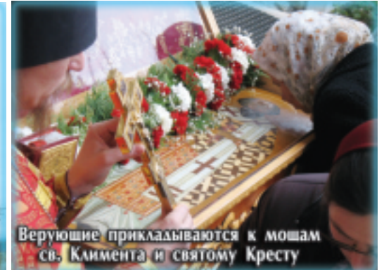
Верующие прикладываются к мошам св. Климента и святому Кресту