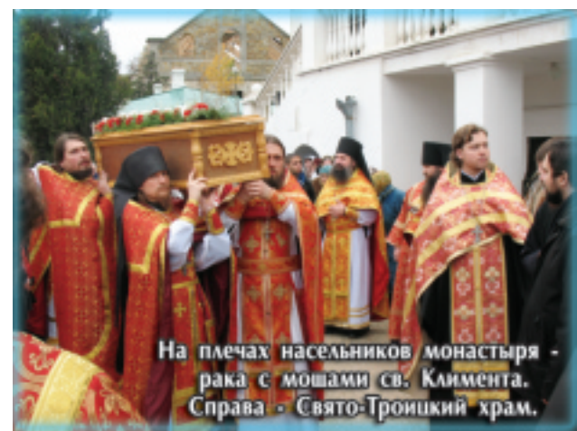
На плечах насельников монастыря - рака с мошами св. Климента. Справа - Свято-Троицкий храм.