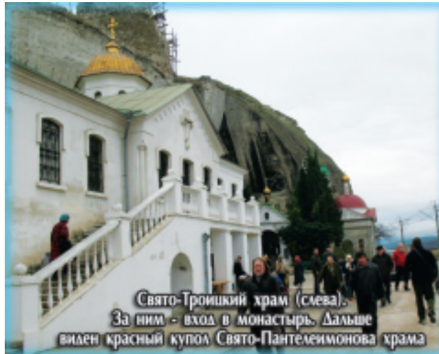
Свято-Троицкий храм (слева). За ним - вход в монастырь. Дальше виден красный купол Свято-Пантелеимонова храма

Предлагаем читателям «ХВ» фото-репортаж о престольном празднике монастыря, дне памяти св. Климента Римского (8 декабря 2009 г.).