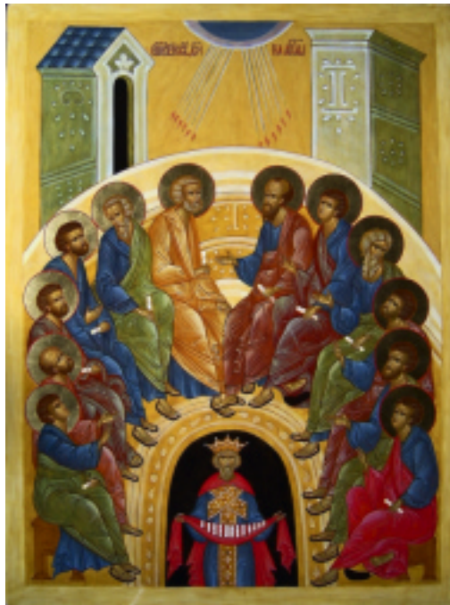
Икона «Сошествие Святаго Духа на апостолов»

Тогда апостол Петр, вставши вместе с прочими одиннадцатью апостолами, ска-